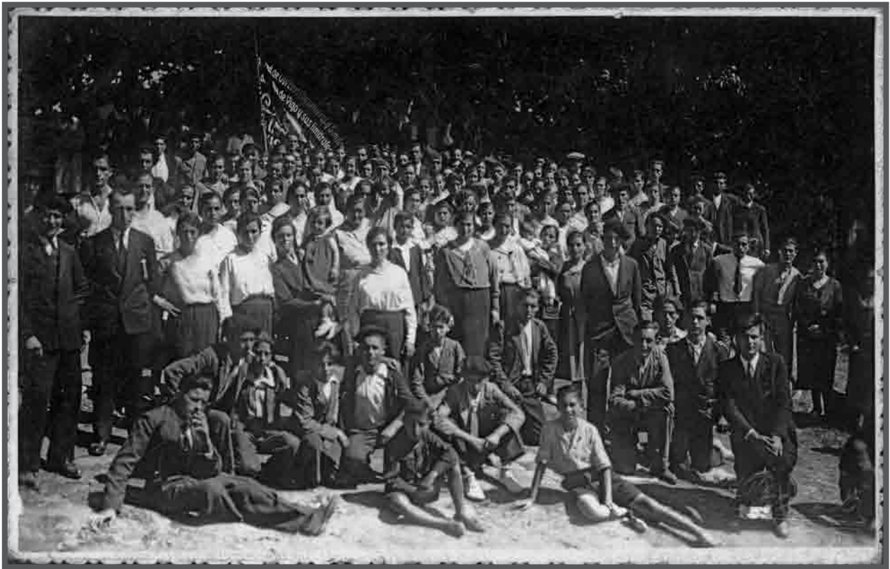
Manifestación obreira. Sociedade de obreiros conserveiros e similares da Ría de Vigo. "La Invencible" [25-11-1932 ata 18-07-1936]. Negociou a revisión do convenio colectivo coa Unión de Fabricantes de Conservas en 1934. AFP2092