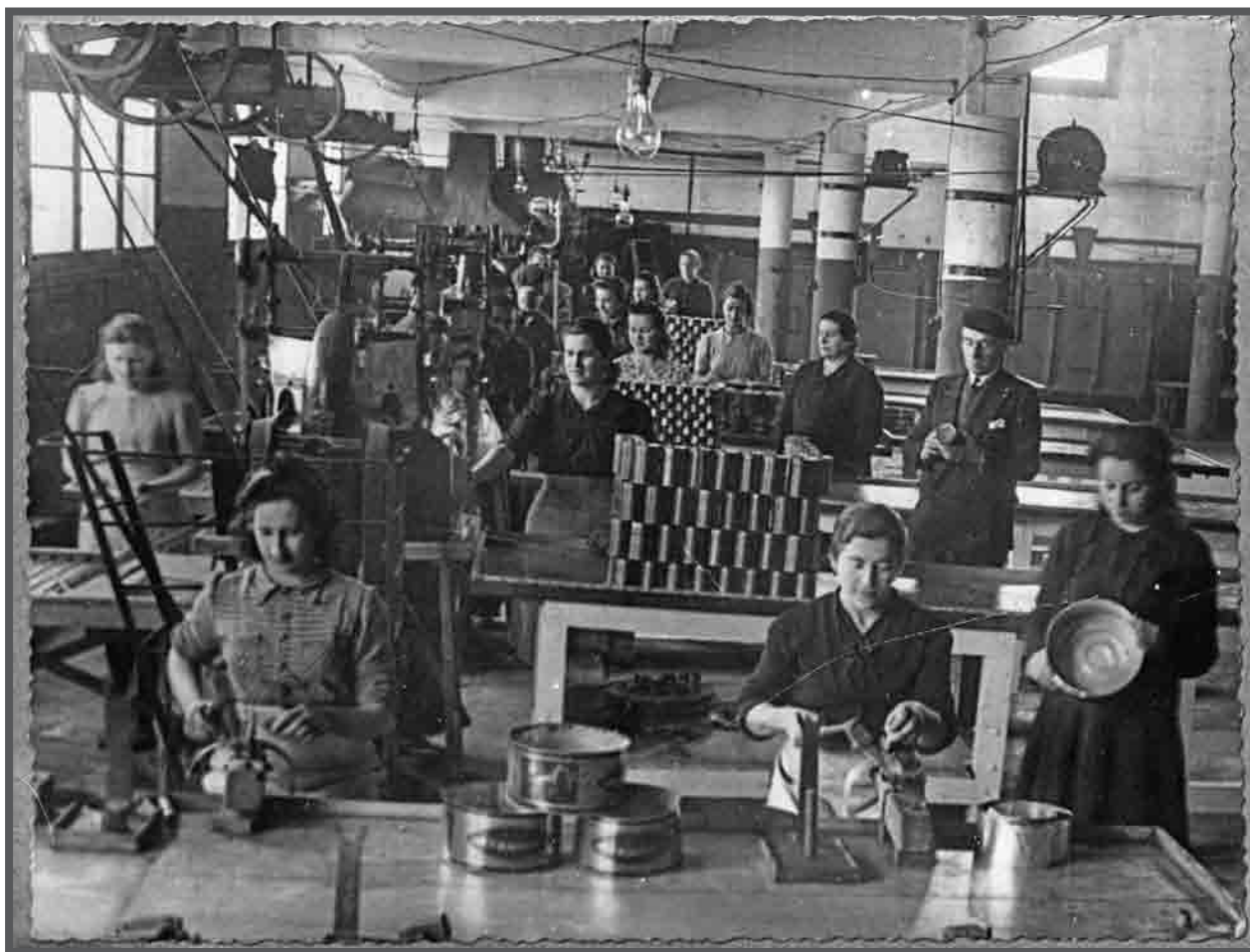
Interior da factoría conserveira en Punta Balea de Massó, Cangas, (anteriormente foi de Darío Lameiro Sarachaga e logo de Benigno Barreras), na década dos 50 pasa a ser factoría baleeira. Obradoiro de baleiro, mulleres soldadoras en primeiro termo. c.1939. AFP200650