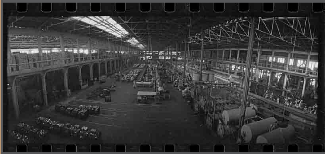
Interior da factoría conserveira Massó Hermanos, S.A. en O Salgueirón, Cangas c.1970. AFP200554

A man obreira da industria conserveira é principalmente feminina. O traballo nas conserveiras supuxo unha importante fonte de ingresos para as economías familiares e para a incorporación da muller ao mercado laboral nas zonas dependentes da pesca. A man de obra que consolidou o tecido fabril vigués procedía dos barrios de Bouzas, Coia, Lavadores, e do Val do Fragoso; millares de vaguesas atentas ao toque das sirenas, á chamada do traballo para coas súas mans carrexar, limpar, empacar, revisar, encher, sertír, acuñar, cortar, e soldar; mans cualificadas as das mulleres conserveiras.