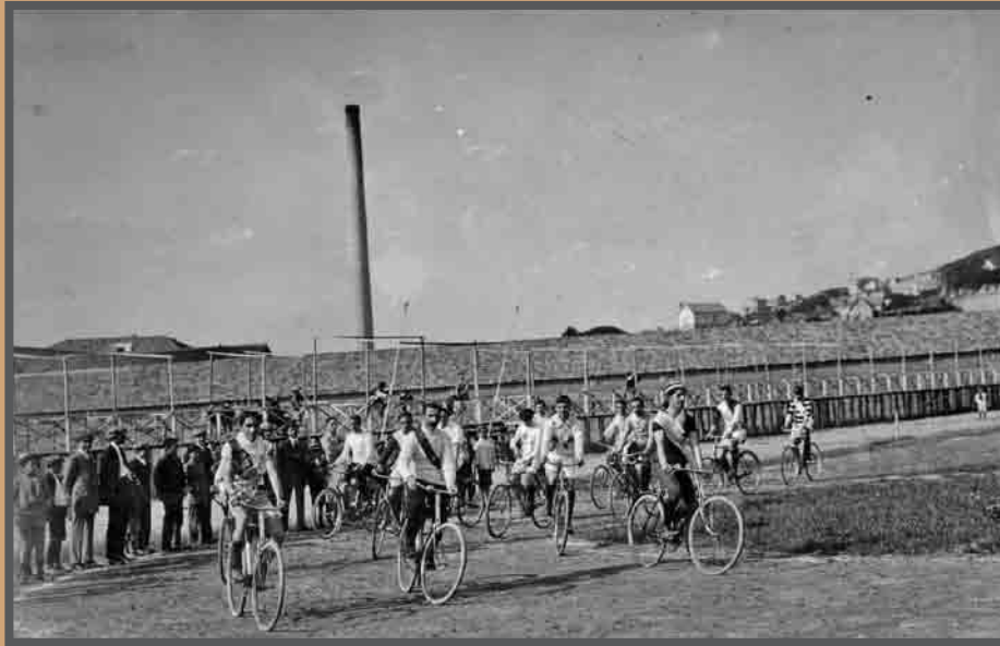
Proba ciclista en campo de Coia, ao fondo a cheminea da factoría conserveira Quirós. AFP322

Vigo foi pioneira na práctica de deportes como o fútbol e o ciclismo. O deporte articulaba boa parte do ocio das clases dirixentes e traballadoras que acudían ao campo de Coia, rodeado de fábricas como pano de fondo. Moitos dos empresarios conserveiros practicaban o deporte, propio da clase burguesa e con considerables éxitos nalgúns casos, e impulsaron a súa práctica fundando o Club de Campo, Aeroclub, Club Náutico.