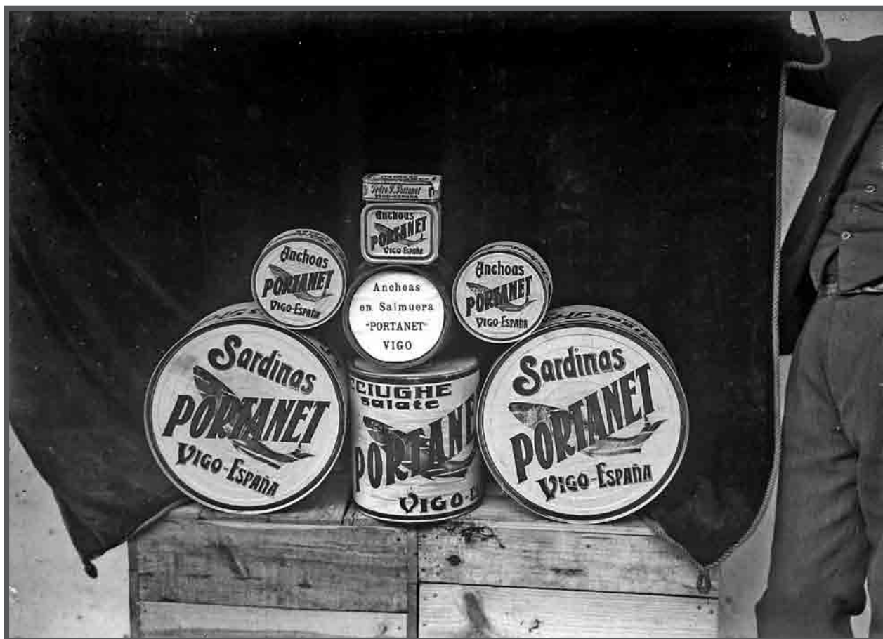
Bodegón de conservas de anchoas en salmoira e xoubas de conservas Portanet. AFP 23993