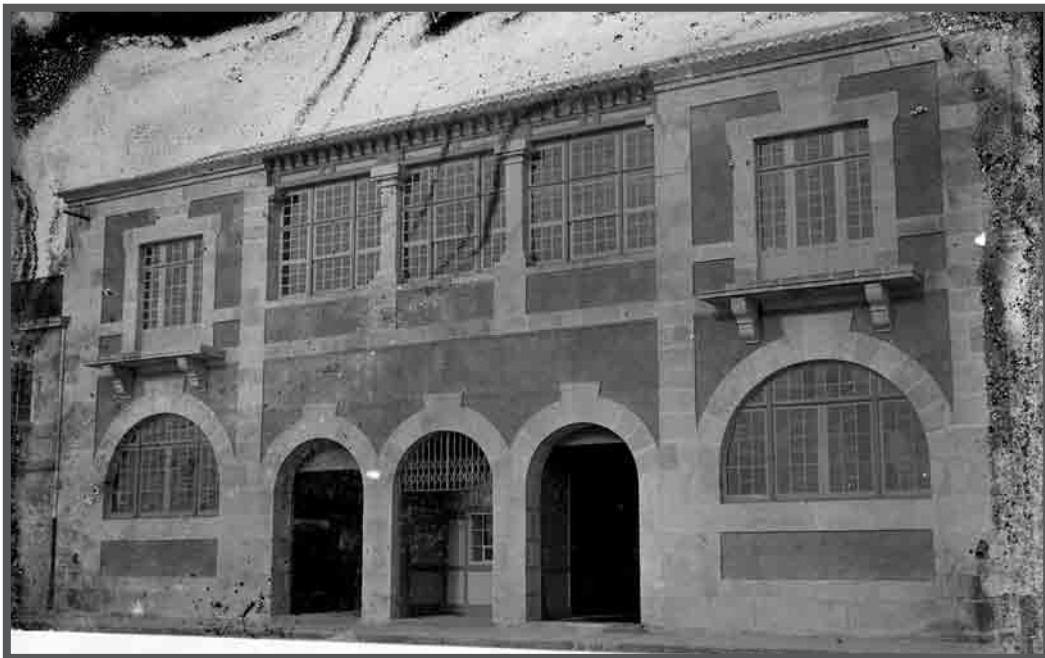
Fachada da factoría conserveira Gándara y Haz, Guixar, rúa Xulián Estévez 40. c. 1927. AFP22611