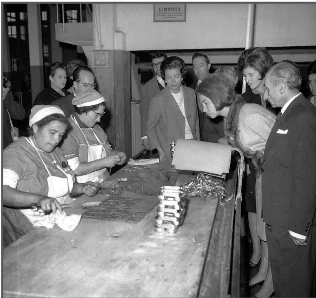
Visita dos Príncipes de España á factoría conserveira Alfageme, c.1964. AFP18834