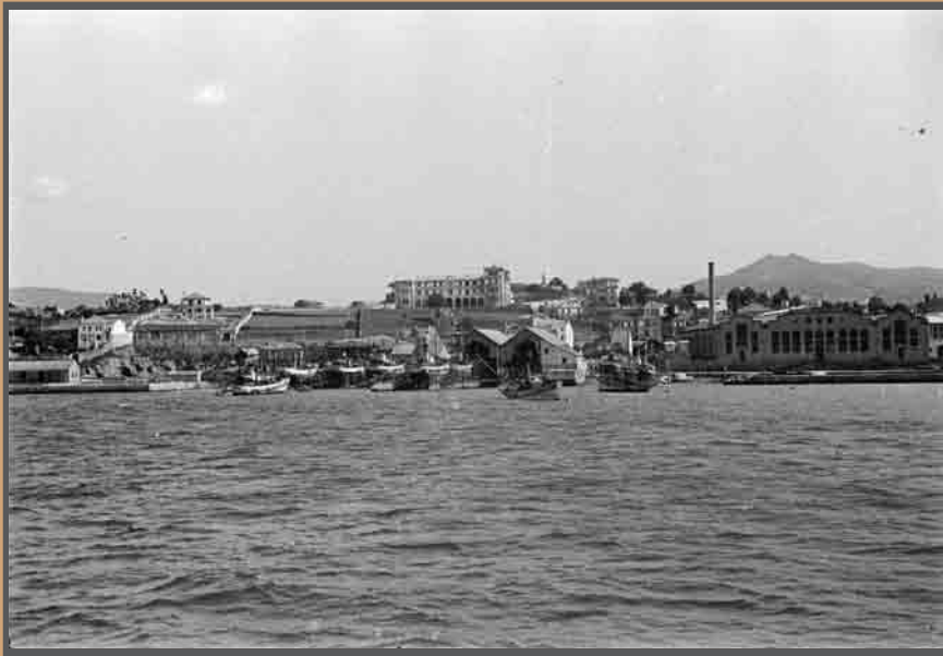
Vigo, Bouzas, á dereita a factoría conserveira Alfageme e ao lado os astaleiros Armada e Cardama. Na década dos 40. AFP5047

No pulso da industria e da cidade, as praias onde se asentaron as conserveiras encheron a paisaxe de chemineas e estaleiros, estendendo os seus dominios dende Teis ata Canido asentándose alí onde había un areal. O desenvolvemento económico ao cabo dos anos esvaeceu a panorámica e engadiu unha gran infraestrutura portuaria.