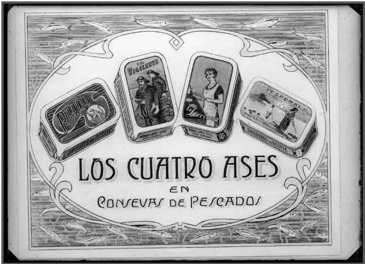
Debuxo, publicidade de Conservas Justo López Valcárcel. AFP59957