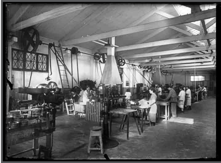
Interior da fábrica conserveira de Cerqueira, obradoiro construción de envases "de baleiro". c.1951 AFP21799