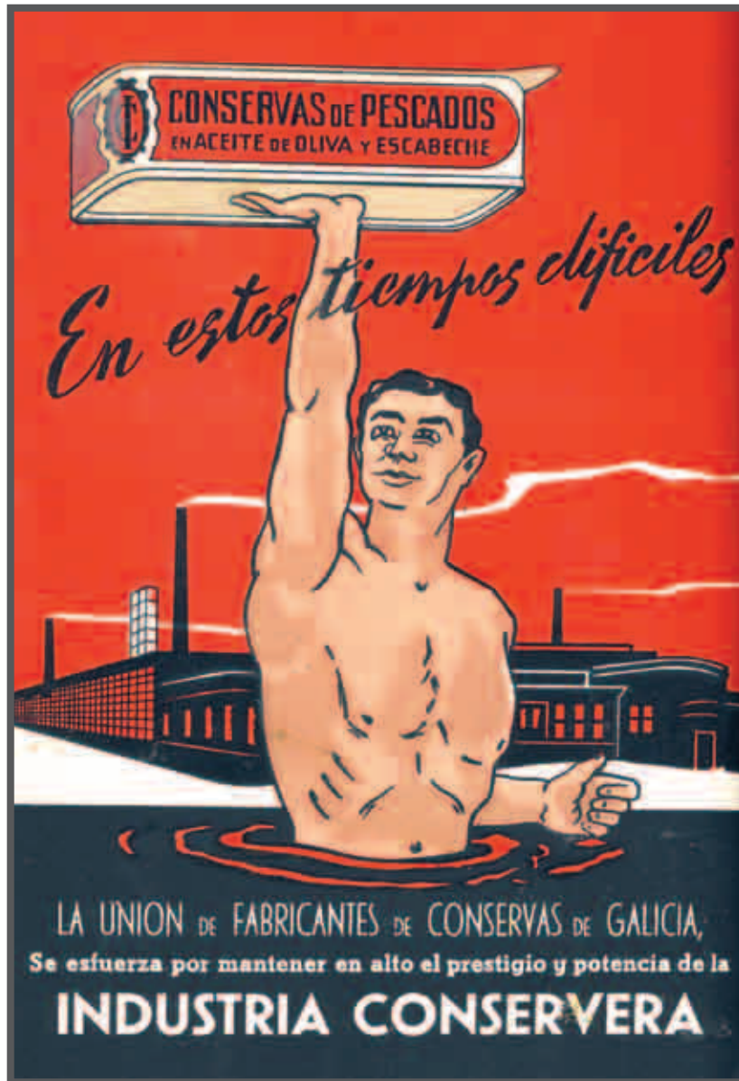
"En estos tiempos difíciles". Revista Industria Conserveira, publicidade da Unión de Fabricantes de Galicia, c. 1946. Museo ANFACO da Industria Conserveira