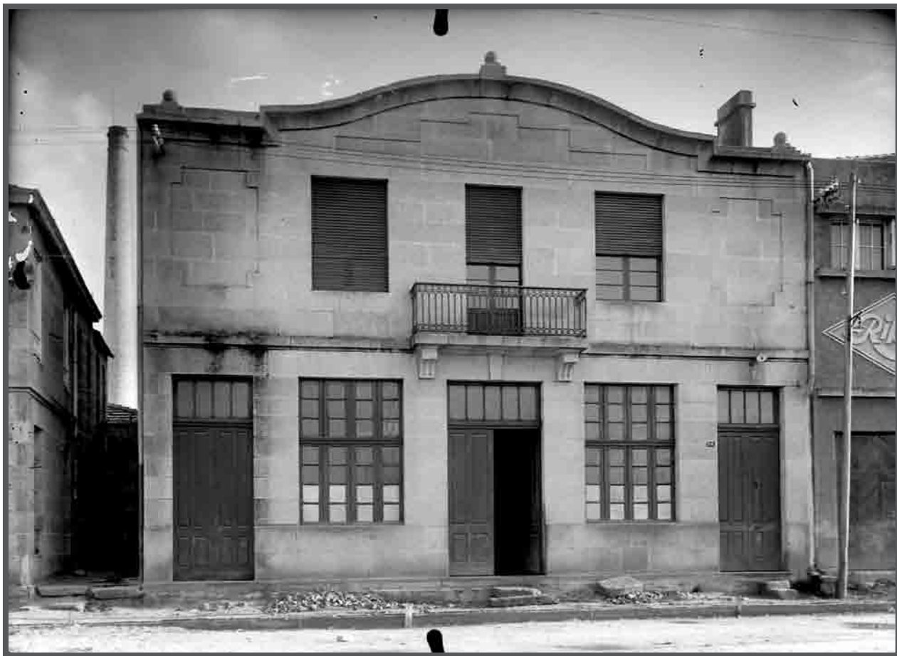
Fachada da factoría conserveira Cerqueira, Coia, rúa Tomás A. Alonso, ao carón a fábrica conserveira Ribas. c. 1951. AFP22397