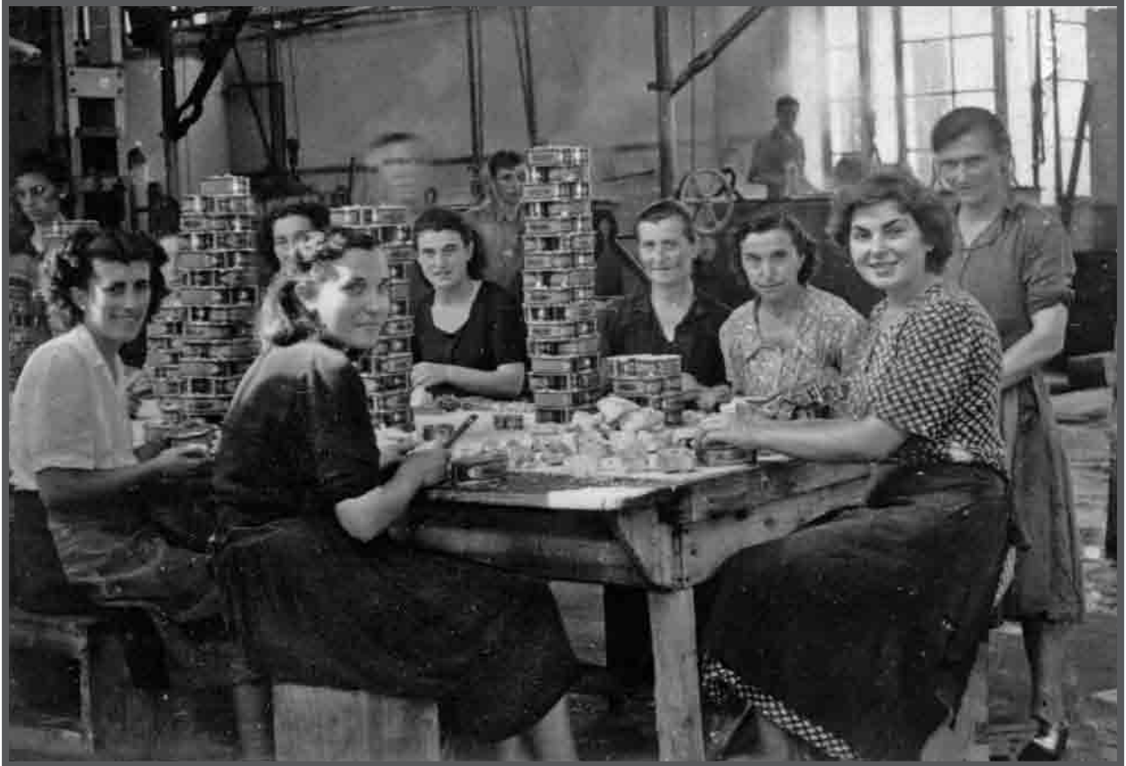
Interior da fábrica conserveira de Antonio Alonso (Cillero), mulleres na mesa de empaque. c.1945.