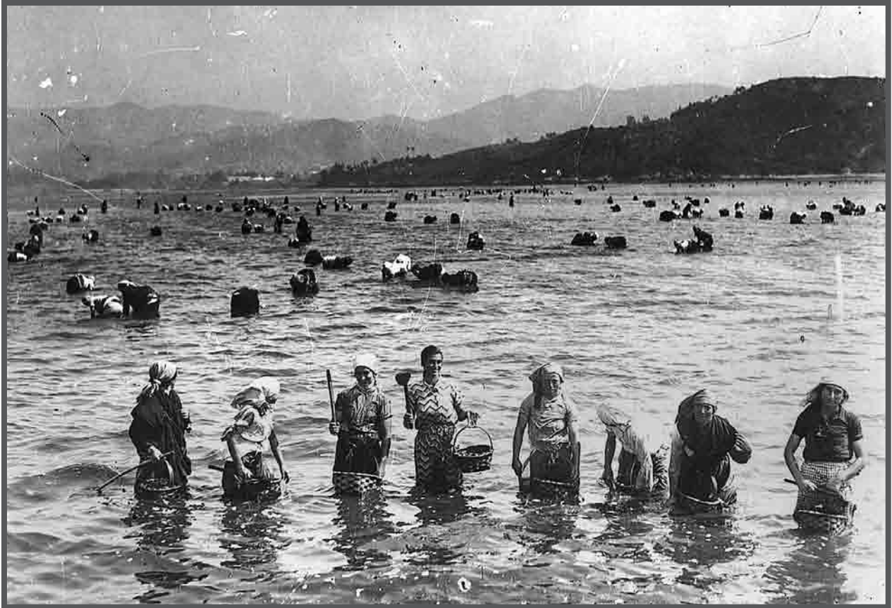
Mariscadoras na Ría de Vigo. c.1933 AFP2760