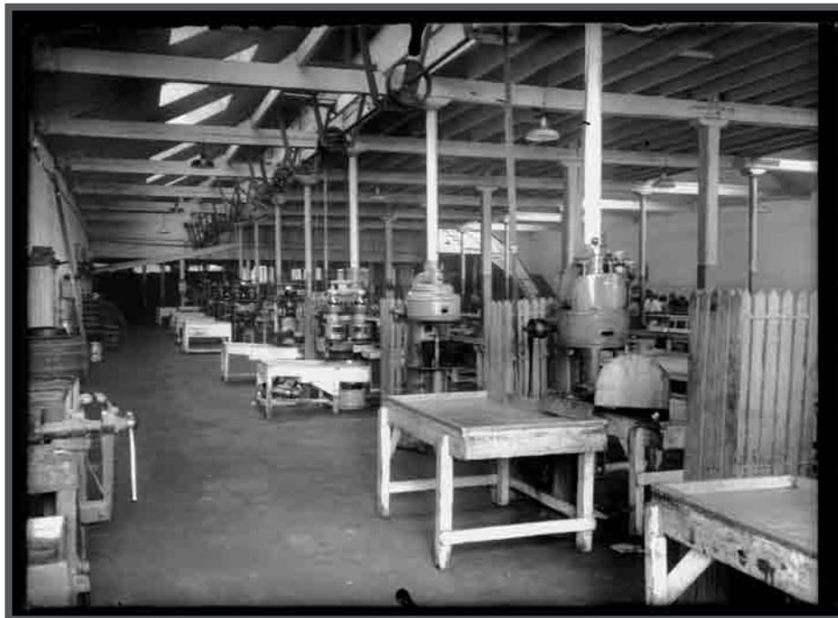
Interior da fábrica conserveira de Cerqueira, sección de peche. c.1951. AFP22394