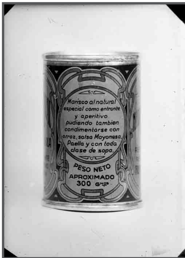
Conserva de Marisco "Marisco al natural" M. López Valeiras S.L. c. 1946. AFP21045-21055