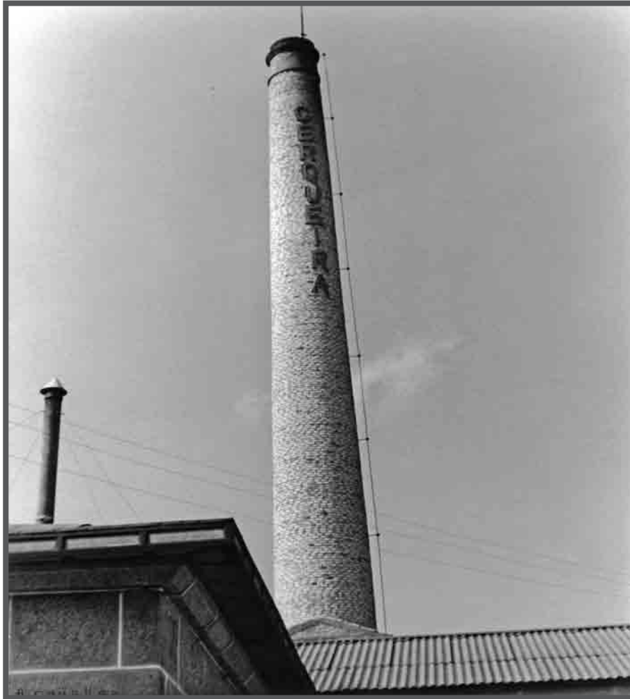
Cheminea da factoría conserveira Cerqueira, na rúa Tomás A. Alonso. Arquivo fotográfico Cerqueira S.A. c.1951