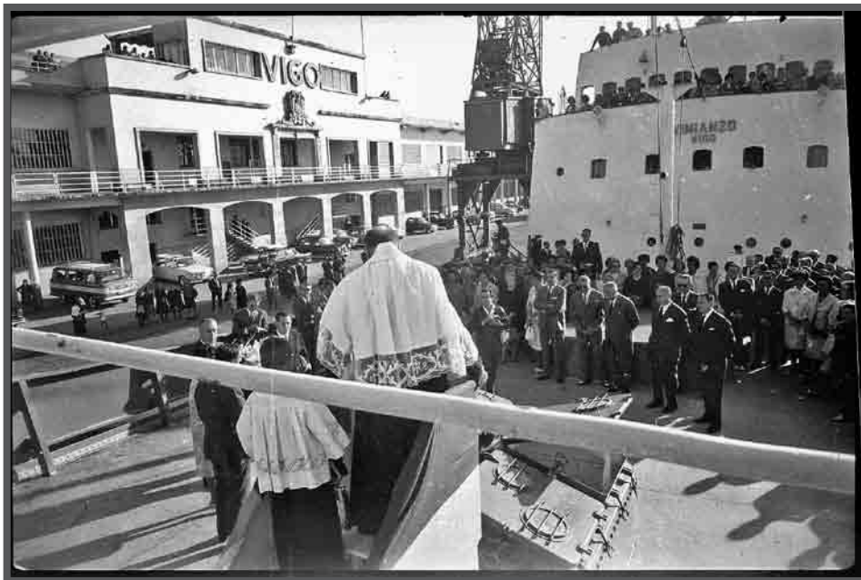
Botadura do conxelador ramplero "Vimianzo" de Pescanova. Primeiro buque de España que permite a pesca por popa. A incorporación da rampla supuxo outra revolución nas faenas da pesca. 16-9-1963. AFP11366