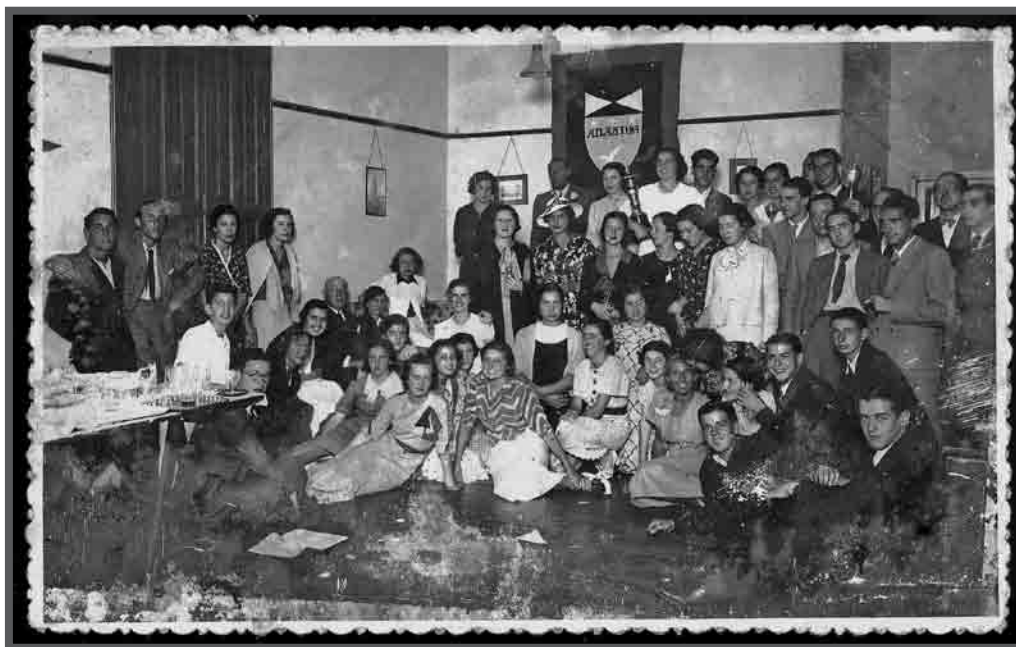
Deportistas do Atlántida Club. c. 1935. AFP2995