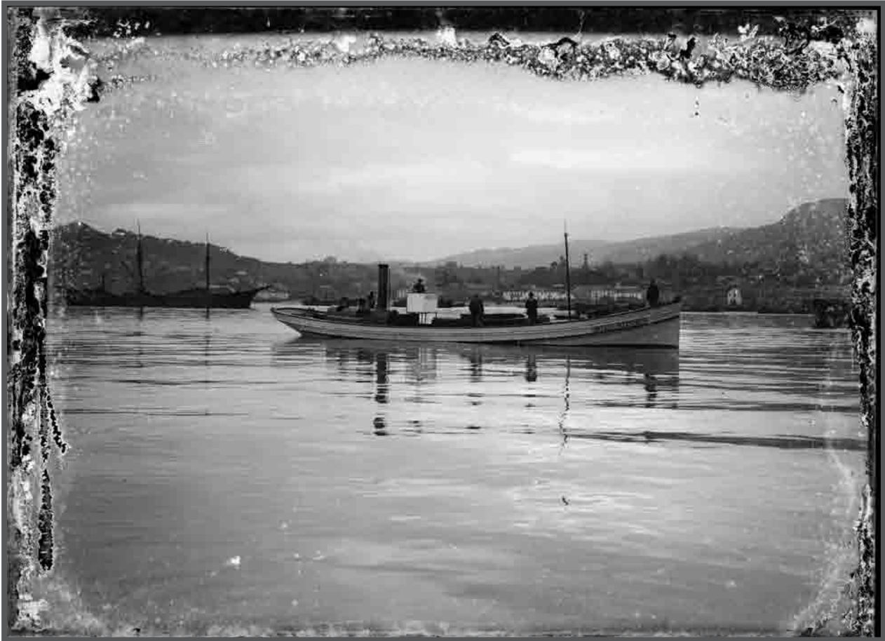
Buque vapor tipo Vigo, ao fondo a praia de Guixar e as factorías conserveiras de Tapias, Pita, e Dotras e a de Rodolfo Alonso Lamberti... c.1910. AFP201998