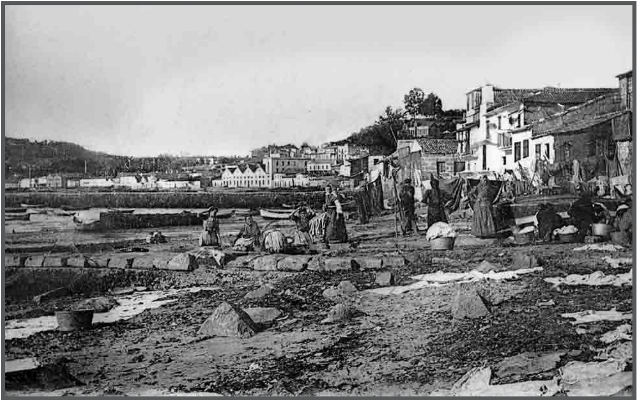
Vigo, praia do Areal das Monxas e ao lado praia de Guixar. Fábrica de Barreras, A Rebouza (1899-1923), ao lado as fábricas de Tapias, Pita e Dotras, e ao fondo a fábrica de xabóns A Iberia. c.1910.