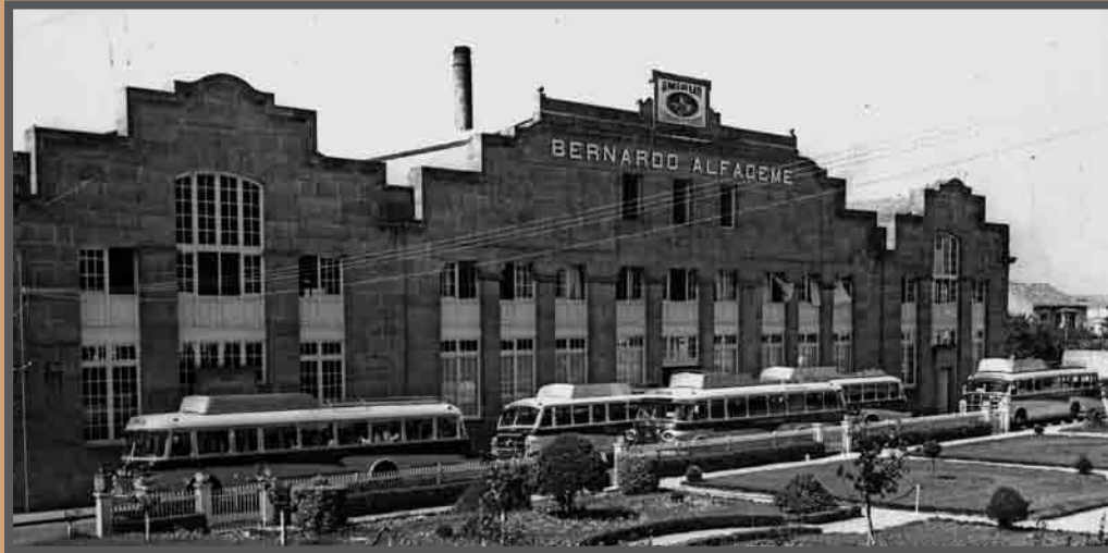
Fachada da factoría conserveira Alfageme, en Bouzas, rúa Tomás A. Alonso. Proxectada por Manuel Gómez Román, c.1929. Museo ANFACO da Industria Conserveira.

Os edificios da industria conserveira poboaron Vigo, contabilizábanse 43 fábricas xa a mediados do século XX, ao igual que outros edificios emblemáticos moitos deles desapareceron levándose a identidade de toda unha cidade, mentres que os esquecidos esperan á súa sorte.