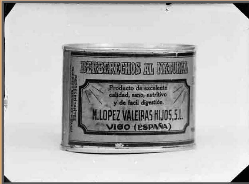
Envase de López Valeiras. "Berberechos ao natural". c.1940. AFP21034

Algúns dos reclamos de antano, forman parte da colección museográfica do Museo ANFACO: a embalaxe das conservas de pescado e marisco, latas e estoxos en multiplicidade de formatos, catálogos, folletos, anuncios de revistas, cabeceiras das cartas corporativas, o mundo das imaxes e as técnicas de comunicación comercial que explican en boa medida as sociedades que as xeraron.