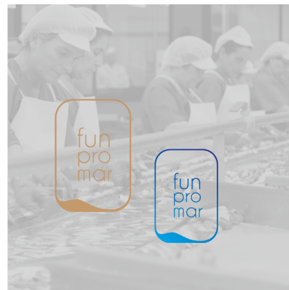
SOBRE ENTORNO FOTOGRÁFICO CLARO