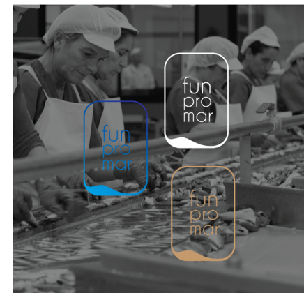
SOBRE ENTORNO FOTOGRÁFICO OSCURO