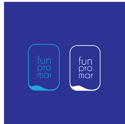
SOBRE PANTONE 7473C