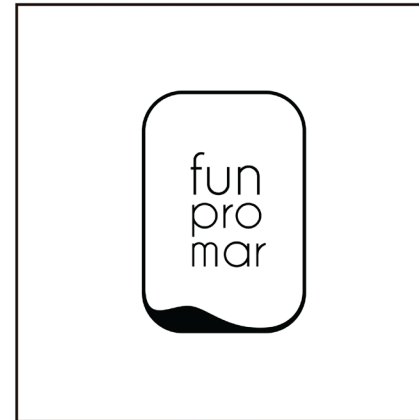
NEGRO SOBRE BLANCO