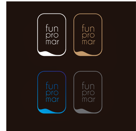
BLANCO SOBRE NEGRO