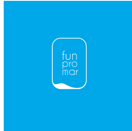
SOBRE PANTONE 7475C